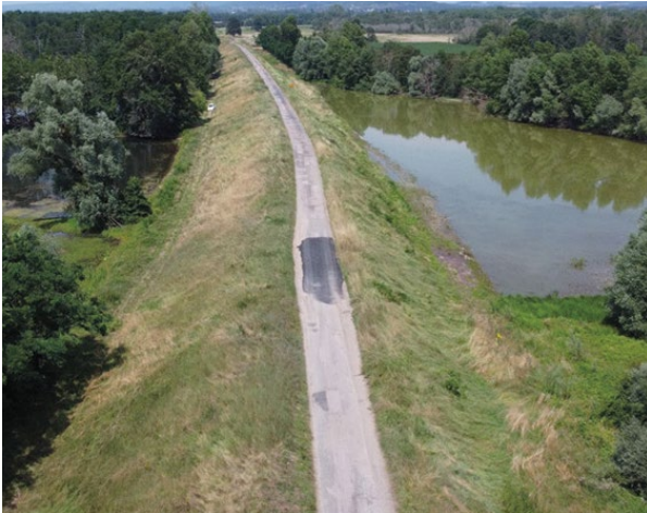
Stigmates de la brèche de Laubray (XIX ème siècle).

Une digue constituée d'un mélange de sable et d'argile, appelée levée, est poreuse. Lors d'une crue, l'eau s'y infiltre. Cette perméabilité dépend entre autres de la structure interne du remblai, du matériau utilisé et de son histoire. Pour une digue très imperméable (par exemple en béton), l'infiltration est très lente et franchit difficilement son épaisseur. Pour une levée plus perméable et lors d'une crue assez haute, l'infiltration peut traverser la digue et suinter du côté protégé.