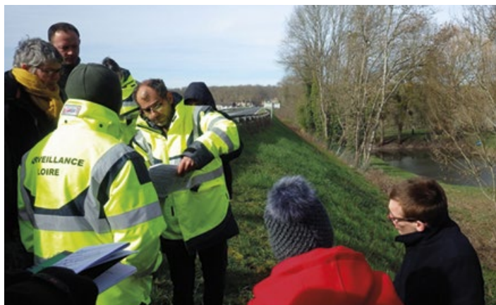
Surveillance en crue (exercice) et dépression du Guétin.

Des exercices de simulation de crise sont organisés chaque année par la préfecture, en partenariat avec les élus et la préfecture de région. Lors des exercices, la DDT simule une surveillance en situation de crue, et s'assure de la bonne coordination des agents et de la fluidité du transfert d'information. Chaque exercice fait l'objet d'un retour d'expérience systématique. Dans le Cher le dernier exercice de ce type a été déclenché en février 2021.