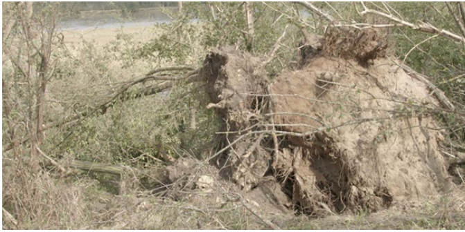
Déracinement lors de la tempête de grêle du 19 juin 2021 (Cher) près de la digue de Beffes.