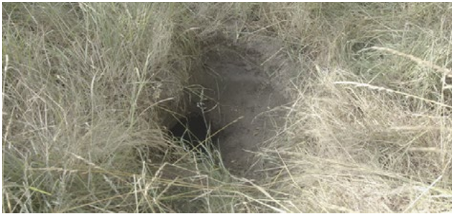
Entrée d'un terrier de Blaireau, 2020.

LES ANIMAUX FOUISSEURS creusent leurs terriers dans la digue. Ils fragilisent la digue de l'intérieur. Les visites de surveillance vérifient qu'aucun animal ne s'installe, et qu'ils n'y prolifèrent pas. A la moindre détection, une réparation est programmée sans délai : les animaux sont chassés et leurs terriers comblés.