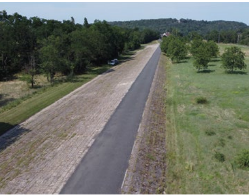
Déversoir du Guétin (1870).