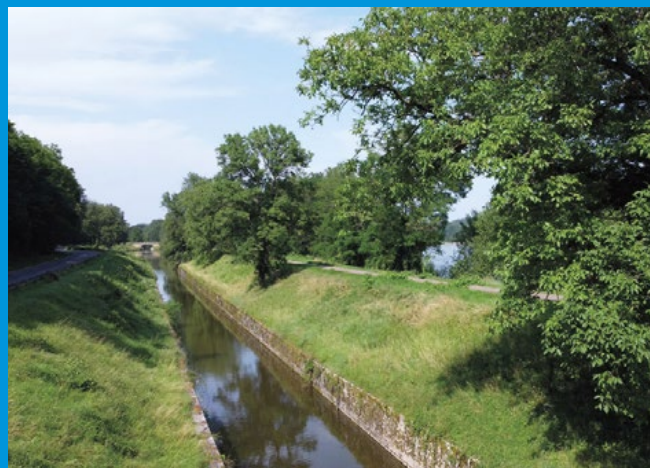
Rigole des Lorrains.

La DDT inspecte également les ouvrages hydrauliques des autres gestionnaires (VNF, collectivités, privés...) qui contribuent au système d'endiguement. En cas de dysfonctionnement, elle alerte son gestionnaire. Certains ouvrages critiques pour la protection contre les inondations, font l'objet de deux visites supplémentaires, en juin et septembre de chaque année.