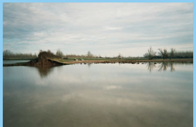
Brèche de Livry (Nièvre, 2003).

LA SURVERSE intervient lorsque l'eau dépasse la crête de la digue. Elle s'écoule alors vers le val, accélère et érode le talus en arrachant les matériaux du pied de digue. Cette érosion rapide conduit à la rupture totale. Pour le système d'endiguement du