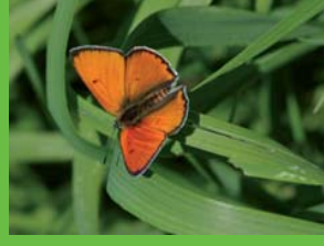
Culivré des marais (prairies humides)