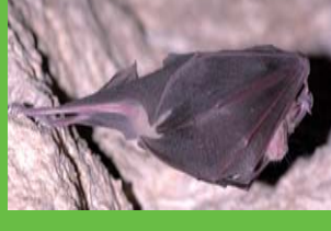
Petit Rhinolophus (bâtiment et site carriériste)