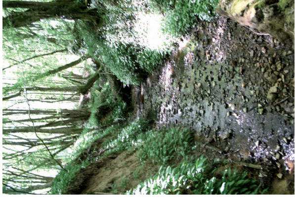
Rivière à écrivisses à pattes blanches