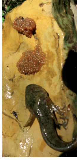
Pont de chabot (ruisseaux et petites rivières)