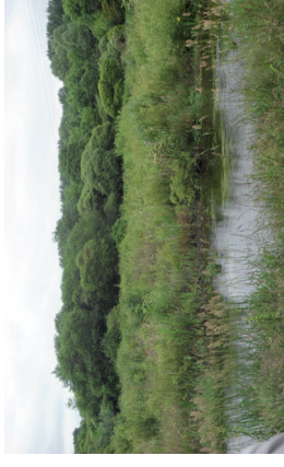
Bas marais calcaire