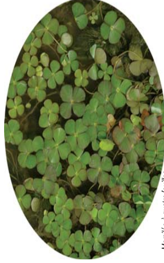
Marsilée à quatre feuilles (zones humides)