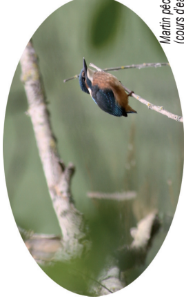
Martin pêcheur (cours d'eau)