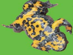
Sommeur à ventre jaune