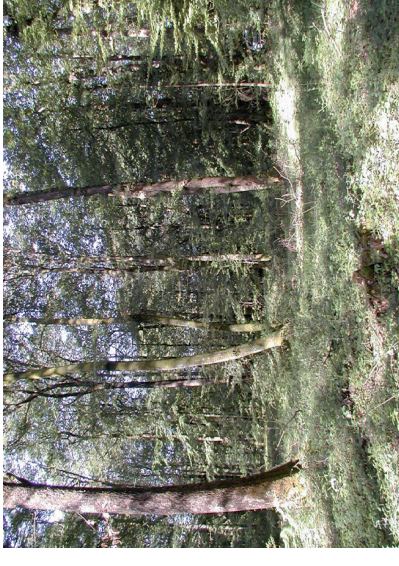
Forêt hêtraie à houx

L'évaluation des incidences Natura 2000 doit toujours être conclusive. Elle doit comporter une phrase où un paragraphe précisant l'incidence ou non du projet sur les objectifs de conservation du site concerné.