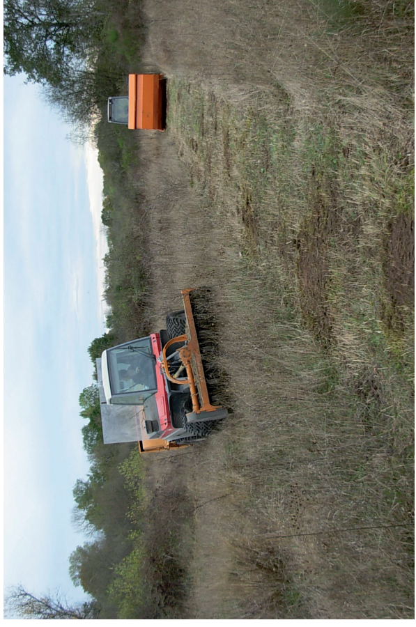
Chantier de restauration de milieu aux abords de la Loire